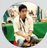
Thai'r Mrayyan Educational Officer at Children's Museum Jordan