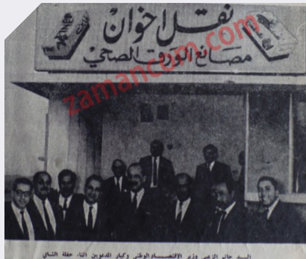
صورة على مدخل المصنع